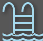
eaux de loisirs